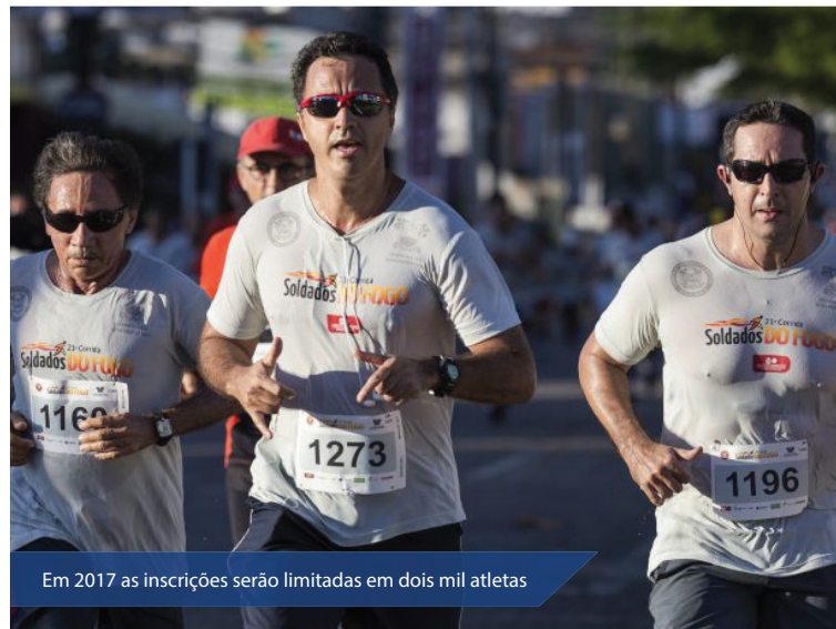
Em 2017 as inscrições serão limitadas em dois mil atletas

As inscrições para a corrida de rua mais disputada do RN já estão abertas e podem ser realizadas exclusivamente através do site www.corridasoldadosdofogo.com.br , que também traz o regulamento e o percurso da prova. De acordo com o Capitão Christiano Couceiro, coordenador do evento, as ações do momento estão para captação dos parceiros interessados em apoiar a Corrida. Em