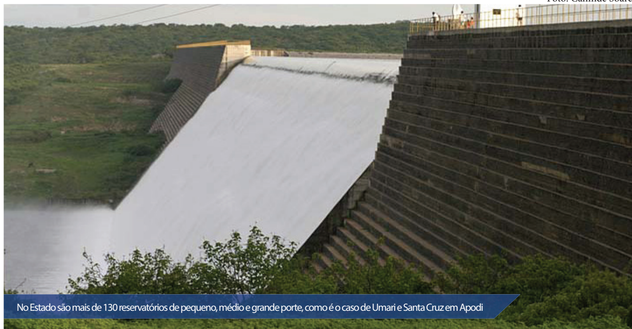
No Estado são mais de 130 reservatórios de pequeno, médio e grande porte, como é o caso de Umari e Santa Cruz em Apodi

O Governo do Estado criou um grupo de trabalho para discutir e elaborar um plano de operação, manutenção e contingência das barragens do RN. A portaria foi publicada no Diário Oficial do Estado.