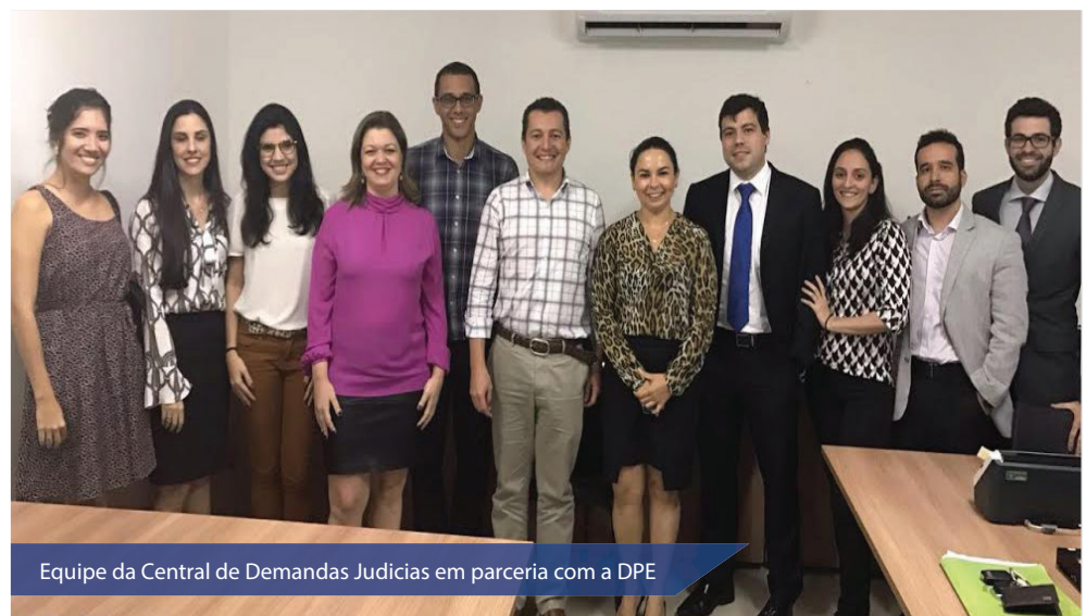
Equipe da Central de Demandas Judiciais em parceria com a DPE

As duas entidades também atuam juntas no projeto SUS Mediado, lançado através de uma parceria entre a Defensoria Pública do Estado do Rio Grande do Norte, a Procuradoria Geral do Estado, a Secretaria de Saúde do Estado, a Defensoria Pública da União, a Procuradoria Geral do Município de Natal e a Secretaria de Saúde do Município de Natal. O objetivo é evitar ações judiciais por meio da conciliação das demandas.